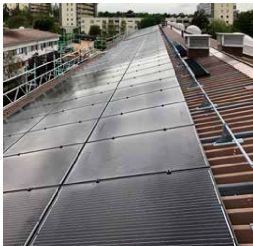
Projekt 3. Lutande plåttak med solcellsmoduler monterad efter takförstärkningar.

» sakta börjar anamma de normer och regler som länge funnits i övriga byggvärlden. För befintliga byggnader behöver också kvalitén på projektering och dokumentation förbättras i entreprenörsledet.